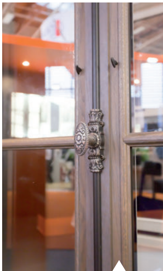
Crémone Prestige en laiton finition gris patiné vieil argent

Les paumelles permettent de fixer les ouvrants sur le dormant. Chaque paumelle est entaillée dans le bois par nos menuisiers en atelier pour un réglage sur mesure.