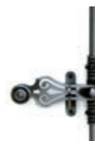
Espagnolette (en option)

La bague en laiton permet d'éviter les frottements entre les deux pièces de la paumelle.